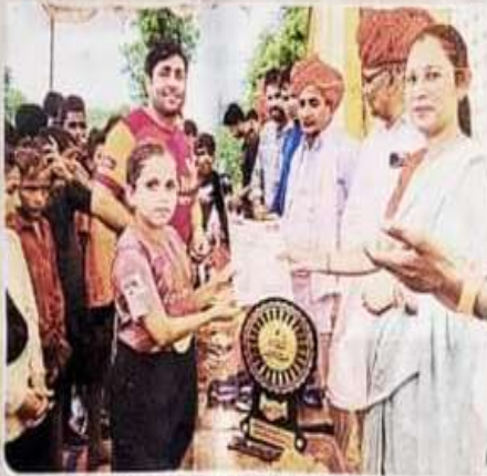
हरिपुरा. विजेताओं को प्रमाणपत्र देकर सम्मानित करते हुए।